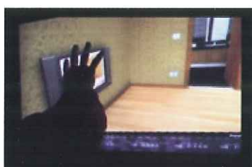
3D設計+インタラクシオン