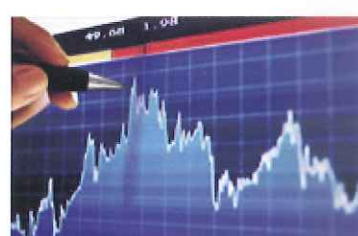
デジタルサイネージ