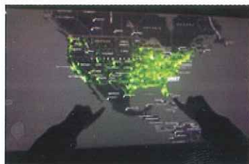
ビジネス用データ可視化